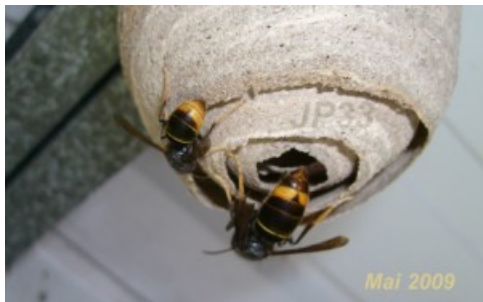
Nid primaire – source : Association Action Anti Frelon Asiatique

Par ailleurs, le dard des frelons est lisse. Cela signifie qu'il peut piquer plusieurs fois.